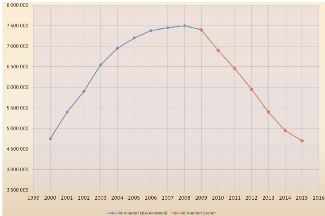
ДИНАМИКА ОБЩЕГО КОНТИНГЕНТА СТУДЕНТОВ ВУЗОВ РФ (2002–2009 гг. — фактические данные, 2010–2015 гг. — прогноз)

количество в ближайшие два-три года увеличится на несколько сотен тысяч по мере сокращения числа государственных и негосударственных вузов.